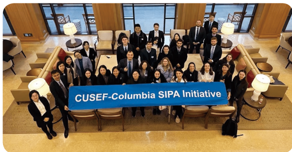
代表团学生访问北京大学和清华大学