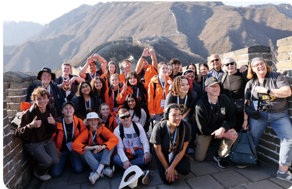
代表团学生游故宫，登长城