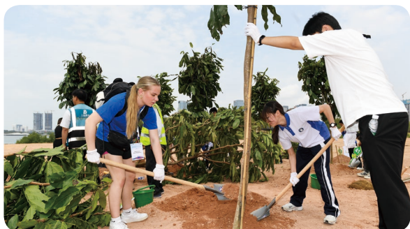
在中美青少年友谊林区共同栽下纪念中美建交45周年的45棵同心树

在3月26日举行的总结欢送活动上，美国师生分享了此访的发现与收获。同学们用幻灯片等方式展示了他们眼中的中国城市、校园和社会生活，表达了对中国社会取得成就的赞叹，并对未来中美两国在环境保护和可持续发展等领域加强合作提出青年建议。林肯中学校长霍塞斯表示，亲眼看到的中国与在书本上了解的中国是那么的不同，此访收获满满，超出预期。该校愿保持对华教育交流的友好传统，组织更多的美国学生来华交流访问。