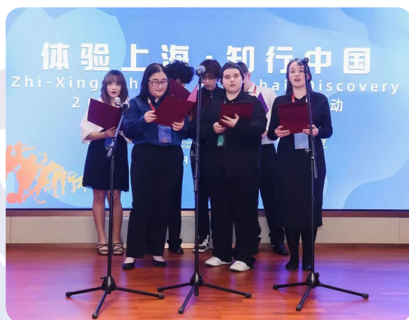
美国马斯卡廷中学在“中美青年说”中表演诗朗诵

29日晚，随着夜幕降临，小客人们登上游轮，参加中美青少年联谊活动总结大会。两国青少年代表上台分享联谊活动的收获并参加联欢表演。船外江风习习，舱内暖意融融。欢声笑语中，彼此依依惜别，播下友谊的种子，相约来日方长。