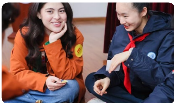
美国马斯卡廷中学学生参加机器人体验活动