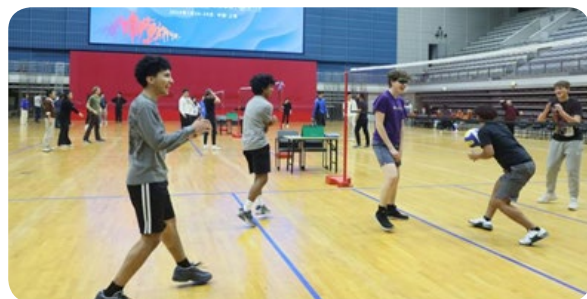
马斯卡廷学生参与气排球友谊比赛

1月24日，马斯卡廷中学学生代表团应邀抵达北京。小客人们逛故宫、爬长城，随后前往河北石家庄外国语学校，以“语伴”结对的形式和当地学生交流互动。26日抵达上海后，马斯卡廷中学的学生们加入到中美青少年联谊活动中。