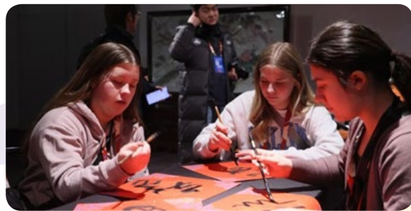
学生们来到豫园感受中国传统文化

学生们还来到复旦大学，在美国研究中心观看复旦大学对美交流图片展，了解中国古籍装帧与修复技术并体验古法制作纸张，还参观了历史建筑相辉堂。1984年4月30日，时任美国总统里