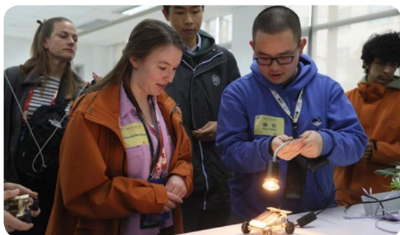
美国马斯卡廷中学学生与复旦大学附属中学学生分享所见所闻

在复旦大学第二附属学校，校民乐团为远道而来的朋友准备了《步步高》等中国传统乐曲演奏表演。两国学生还分为四组，围成圆圈席地而坐做游戏，根据手中卡片的提示分享彼此的兴趣爱好。两国学生你一言、我一语，在交流互动中增进友谊。游戏过后，学生们还体验了剪纸、编中国结、包春卷等传统习俗。