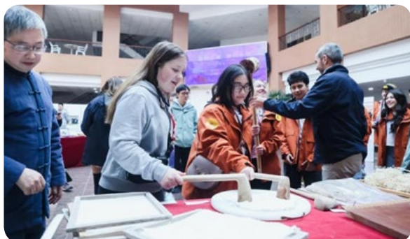
美国马斯卡廷中学学生用锤子打纸浆，亲身体验古法制作纸张

在复旦大学第二附属学校，校民乐团为远道而来的朋友准备了《步步高》等中国传统乐曲演奏表演。两国学生还分为四组，围成圆圈席地而坐做游戏，根据手中卡片的提示分享彼此的兴趣爱好。两国学生你一言、我一语，在交流互动中增进友谊。游戏过后，学生们还体验了剪纸、编中国结、包春卷等传统习俗。