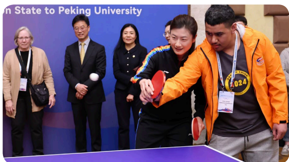
代表团学生与乒乓球奥运冠军丁宁切磋球技