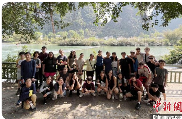
学生们在漓江边合影

3月26日，来自美国旧金山中美国际学校的36名师生抵达桂林，开启为期11天的研学之旅。