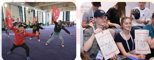
代表团学生体验中国传统文化与中国饮食文化