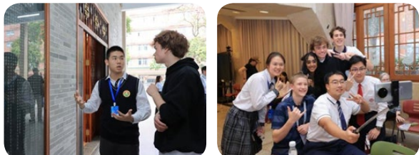
代表团学生与中国学生深度交流