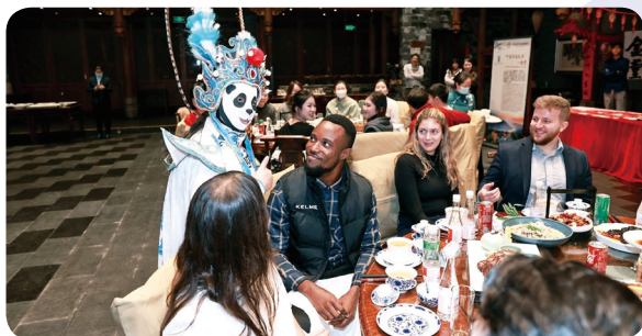
学生代表团参加“中美青年交流联谊会”