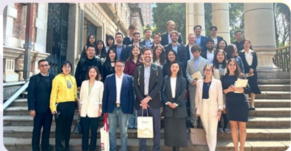
学生团在云南大学