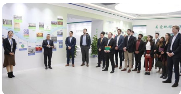
学生团在中国节能环保集团