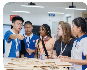
通用技术课堂 | 激光造物