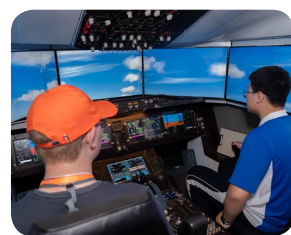
飞行模拟课堂 | C919 云端逐梦