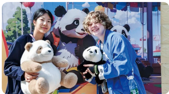
4月21日，中美学生在石家庄动物园大熊猫馆内手持熊猫玩偶留影

美国中美研究中心特聘研究员、曾任昆山杜克大学常务副校长的丹尼斯·西蒙说，“中美教育交流和学术合作一直是双边关系基础要素之一”。