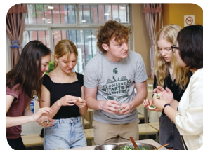
学生们参与文化体验与文化考察活动