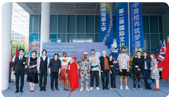
4月26日，在温州肯恩大学，中美师生共同参加国际文化节活动

过去18个月，雷波列特已4次来华。他给自己制订的目标是，每个学年至少到中国3次。他认为，想让两国学生理解“交流合作之美”，教育者应作出表率。