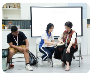
音乐课堂 | 民族音乐《新疆之花》鉴赏