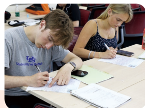
学生们在语言与文化学习课堂上互动讨论

夏令营结束之时，学生们在“写给北师大的一封信”中写道：“我长大以后，也可以回想起我16岁到中国 and 北师大老师们交流和上课的时光”，“以前我一直觉得我要在犹他州上大学，现在我觉得我可以在中国上大学、工作。这是我生活中最好的一段经历，我要再说一遍‘谢谢北师大’”。“If the fates have it, may we meet again,