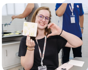
化学课堂 | 蓝晒印象