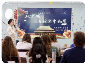
学生们在语言与文化学习课堂上互动讨论

学院对本次研学项目高度重视，针对本期美国学生的中文水平与兴趣需求，参照《国际中文教育用中国文化和国情教学参考框架》对课程进行了精心打磨。以文化知识、文化理解、跨文化意识和文化态度四个维度为教学目标，以社会生活、传统文化、当代中国三个板块的文化项目为教学内容，特别设置有“北京研学打卡”系列主题课程及文化体验活动，配套设计了“论道京华”研学手册，形成“语言与文化主题课堂”+“文化体验活动”+“研学手册”三位一体的课程体系，通过“小组合作”+“任务驱动”+“游戏打卡”的学习方式，更有趣味性地引导学生深入了解中国社会文化，进而巩固中文知识，增强对中文学习的热情。