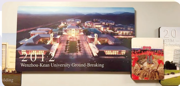
在美国肯恩大学主校区学生中心走廊内悬挂的温州肯恩大学奠基仪式的照片

位于美国新泽西州的肯恩大学主校区学生中心走廊内，悬挂着该校各个校区的照片。其中，温州肯恩大学美丽的校园风景以及奠基仪式的照片，吸引着人们的目光。记者在校园采访的每一个人都了解这个中美合办项目。